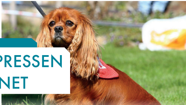
Ti år gamle «Gioia» jobber som besøkshund på institusjoner, og har aldri vært syk, skriver forfatteren.

God helse og godt gemytt er det viktigste når man skal avle rasehunder. Å forby enkelte raser skaper bare flere problemer.