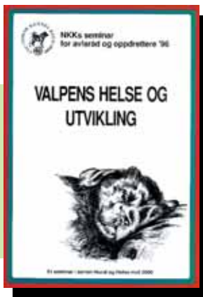
Pris kr. 100,- + porto