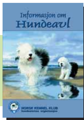
Info om hundeavl i ny utgave ISBN 82 - 90 430-20-5

NKK ser det som en selvfølge at medlemmene overholder de