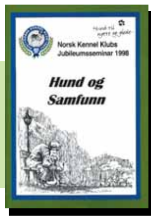
Pris kr. 100,- + porto