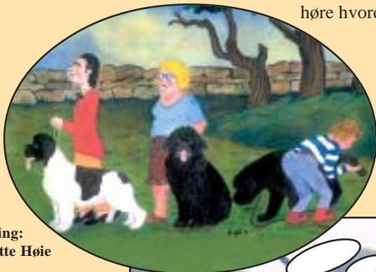
Tegning: Annette Høie

Min lille Morell ble utstillingens beste tissevalp - bare slått av en nesten ett år